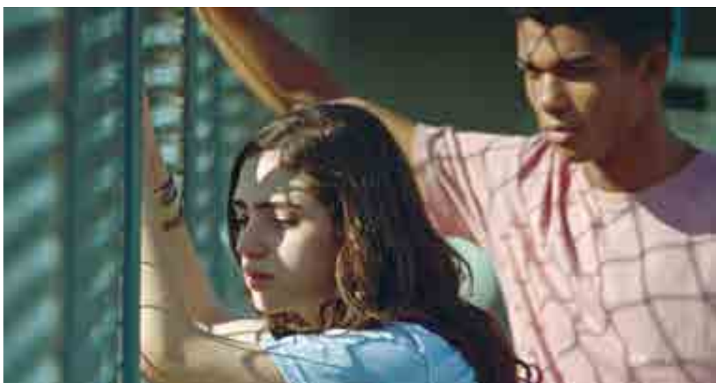
Longa-metragem 'Sem seu sangue' está na Mostra Quinzena dos Realizadores, do Festival de Cannes

Two Sisters Who Are Not Sisters, de Beatrice Gibson (Reino Unido / Alemanha / Canadá / França) The Marvelous Misadventures of the Stone Lady, de Gabriel Arantes (França / Portugal) Grand Bouquet, de Nao Yoshigai (Japão) Staw Awake, Be Ready, de An Pham Tien (Vietnã / Coreia do Sul / Estados Unidos) Je Te Tiens, de Sergio Caballero (Espanha) Movements, de Dahee Jeong (Coreia do Sul) Olla, de Ariane Labed (França / Reino Unido) Piece of Meat, de Jerrold Chong e Huang Junxiang (Singapura) Ghost Pleasure, de Morgan Simon (França) The Staggering Girl, de Luca Guadagnino (Itália) That Which Is To Come Is Just a Promise, de Platform (Itália / Holanda / Nova Zelândia)