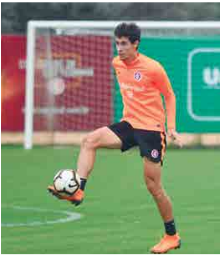
Dourado destacou a qualidade do passe e o chute do companheiro