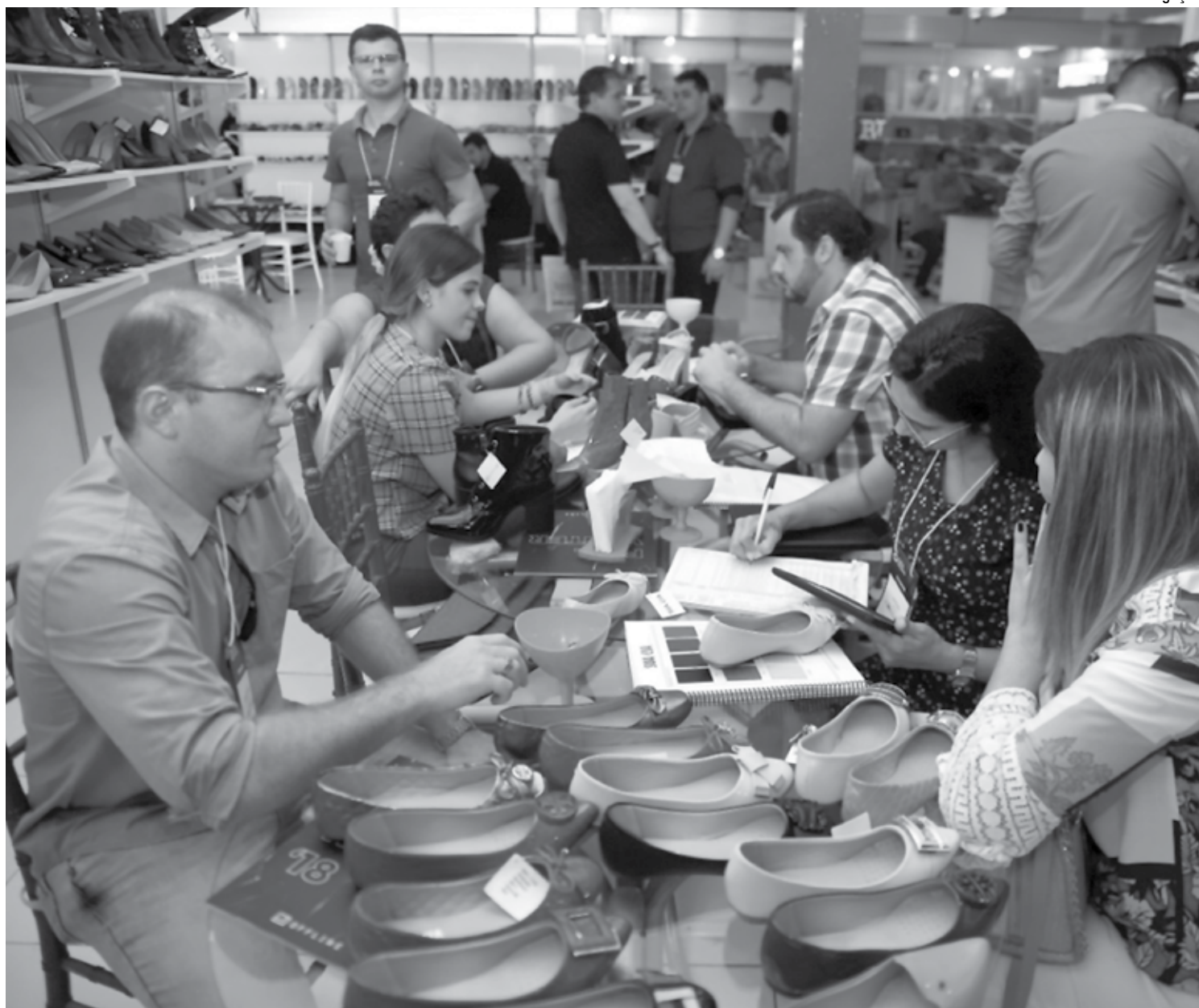
A edição deste ano do evento contará com 70 estandes, que vão expor calçados de indústrias não só da Paraíba, mas também dos estados do Ceará e da Bahia

“O Gira Calçados descentraliza a realização de eventos deste porte das regiões Sul e Sudeste para o Nordeste, possibilitando que as micro e pequenas empresas locais tenham acesso à informação e transformem isso em conhecimento, geração de mais empregos e competitividade para os negócios locais”, afirmou Andréa, ao ressaltar que dos 700 milhões de pares de calçados produzidos por ano no Brasil, cerca de 250 milhões são fabricados na Paraíba,