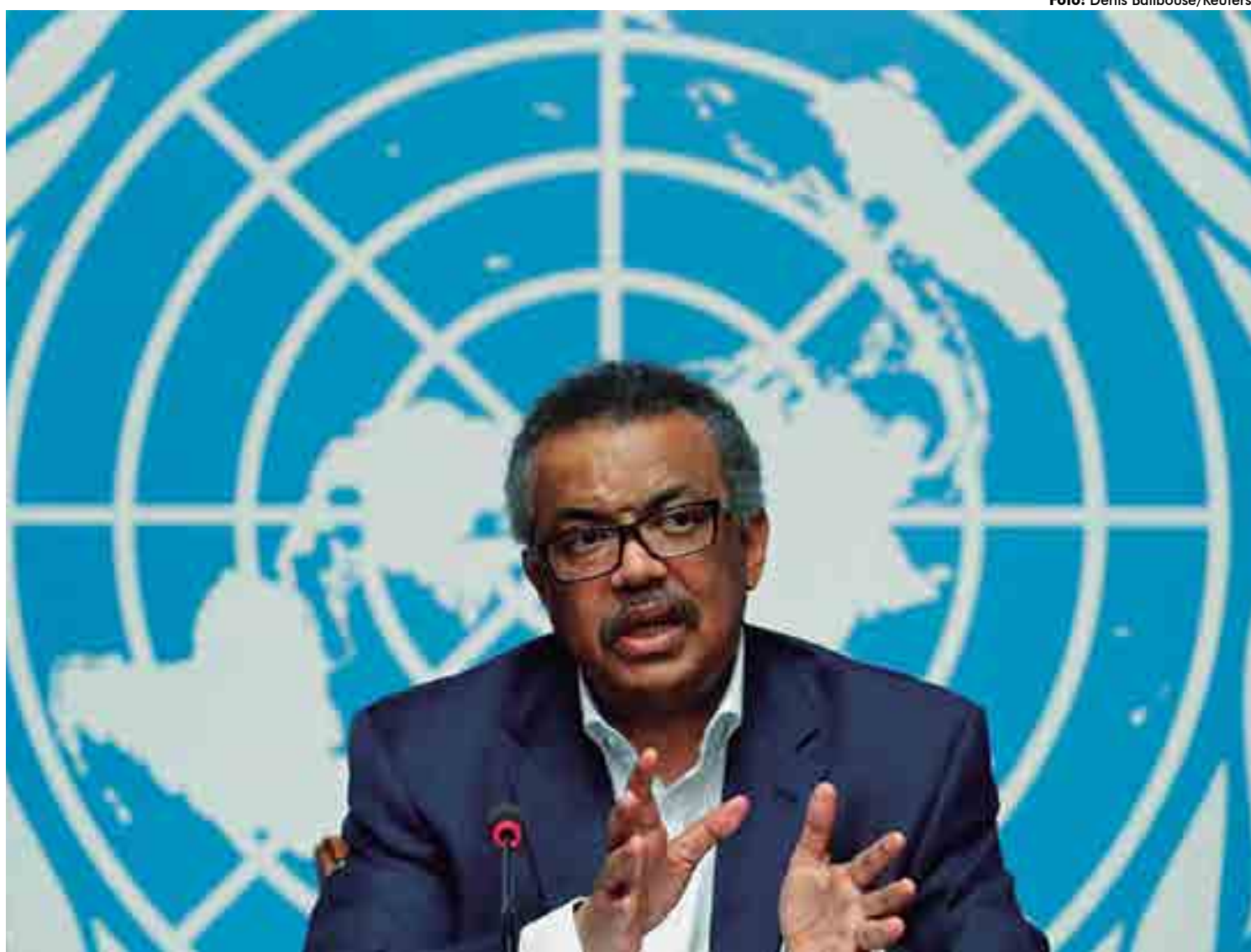
Diretor-geral da OMS, Tedros Adhanom Ghebreyesus, afirmou que a vacina contra a malária "tem o potencial de salvar a vida de milhares de crianças"

O projeto piloto de vacinação, coordenado pela Organização Mundial de Saúde, pretende alcançar 360 mil crianças por ano nos três países. A ideia nasceu a partir da colaboração entre os Ministérios da Saúde de Gana, Quênia e Malawi, além de vários parceiros nacionais e internacionais, incluindo a empresa farmacêutica GSK, responsável pelo desenvolvimento e fabricação da vacina e que doou 10 milhões de doses de vacina para este teste inicial.