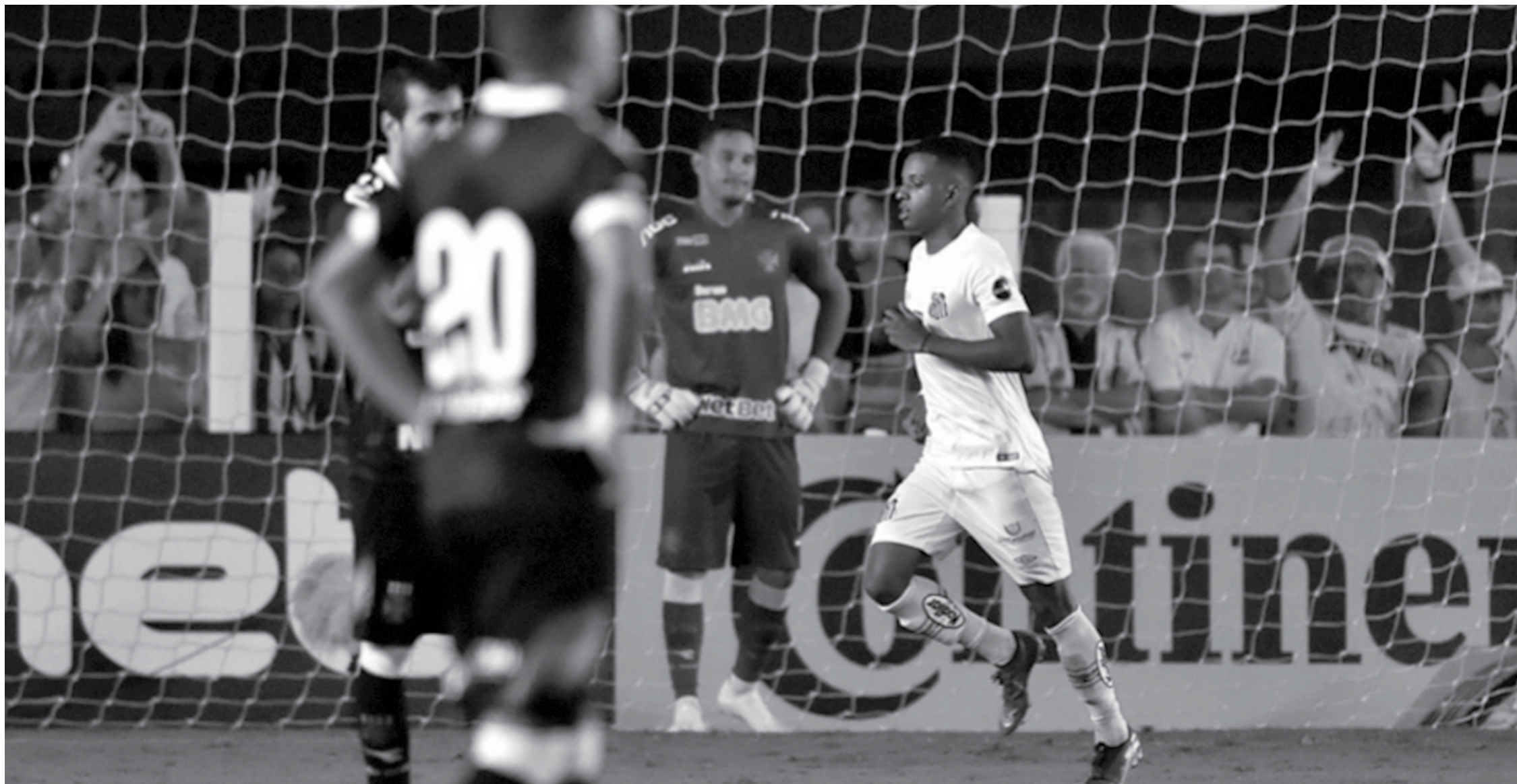
Vasco da Gama vai tentar reverter a vantagem do Santos, que pode perder por até um gol para garantir a classificação. No primeiro jogo, na Vila Belmiro, a equipe de Rodrigo venceu o representante do Rio de Janeiro por 2 a 0