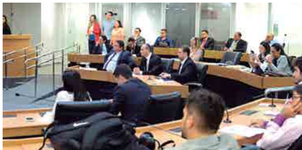
Projeto também obriga os estabelecimentos de ensino a fornecerem o histórico escolar em braille